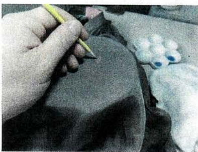
▲筆で慎重に、薄い青をかけていく